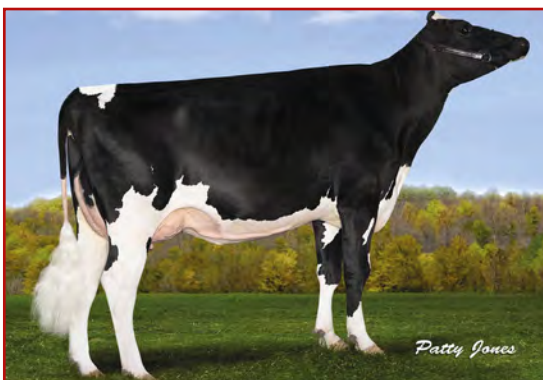
Boldi V S G Epic Aste

BOLDI V S G EPIC ASTER 02-02 305 11 114 3.6% 400 3.2% 361 kg Celoživotně: 18 992 3.6% 689 3.2% 617 kg