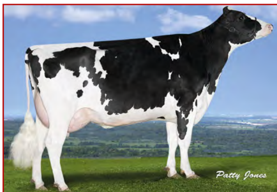
MM: Progenesis Enforcer Pat

PROGENESIS ENFORCER PAT 02-03 305 13 999 3.8% 536 3.5% 492 kg Celoživotně: 21 334 4% 862 3.8% 802 kg