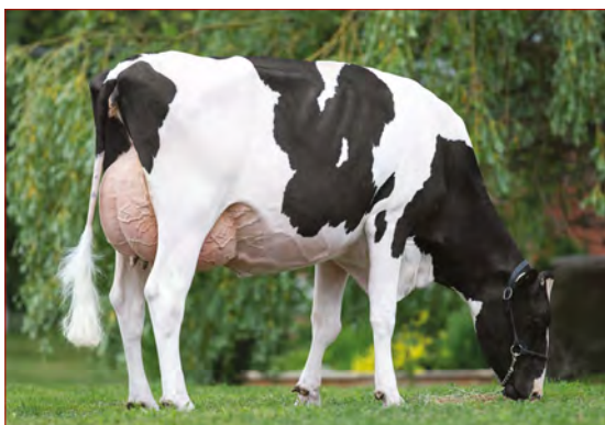
Frontieres Lolly Galore

LARCRESS CRAYON 05-08 229 13 058 4.5% 583 3.2% 424 kg Celoživotně: 65 438 4.3% 2 849 3.3% 2 163 kg