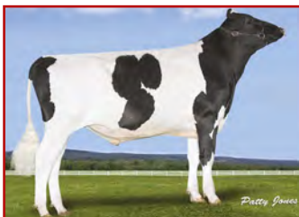
S-S-I MODESTY MAGICTOUCH