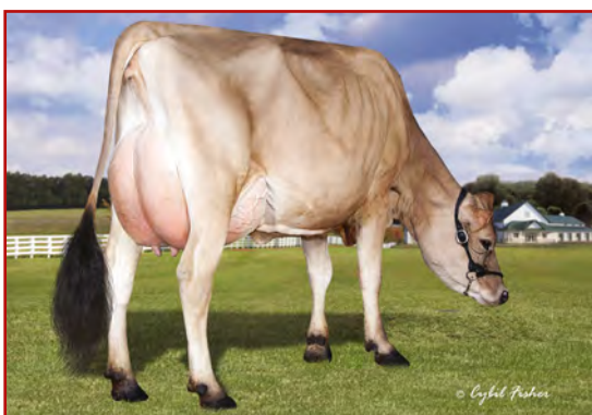
JX River Valley Chrome Cherita