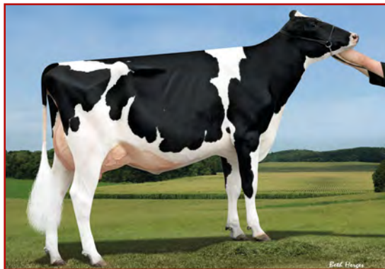
M: Sandy-Valley Bl Paradise

SANDY-VALLEY NU PRECIOS 02-07 305 11 630 4.7% 548 3.6% 419 kg Celoživotně: 14 810 4.7% 699 3.7% 545 kg