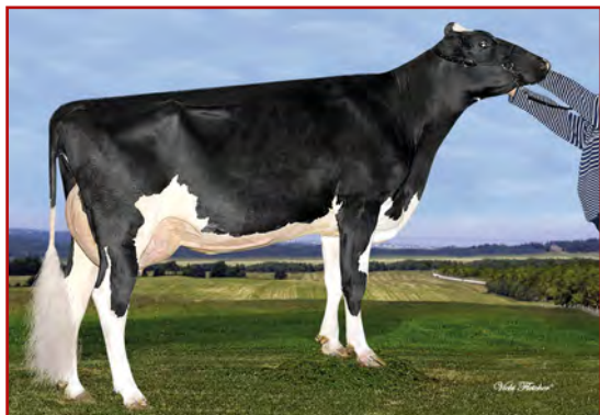
M: Ste Odile Supershot Electra

02-03 305 12 012 3.6% 435 3.1% 370 kg Celoživotně: 23 585 3.8% 888 3.3% 773 kg