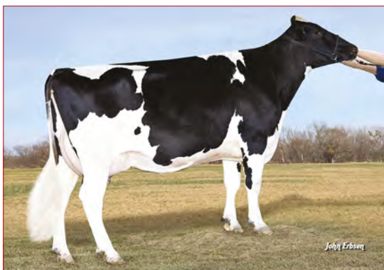
MMM: Roylane ShotMindy 2079