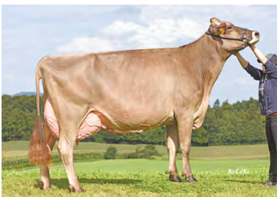
Herrenhof BS Petunia