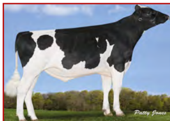
S-S-I MONTROSS DUKE