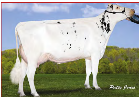
MM: Velthuis S G Snow Evening

VELTHUIS S G SNOW EVENING 02-02 305 13 230 4.1% 546 3.1% 412 kg Celoživotně: 29 004 4.1% 1 179 3.3% 955 kg