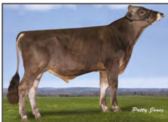
SHILOH BROOKINGS CADENCE