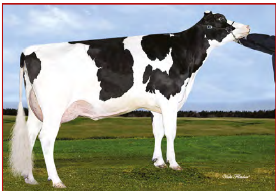
Blondin TJR Bombero Maple

RICHMOND-FD BARBIE 02-04 305 15 177 4.2% 635 3.2% 483 kg Celoživotně: 18 262 4.3% 789 3.3% 611 kg