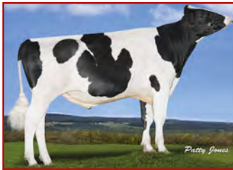
S-S-I MONTROSS JEDI SANDY-VALLEY BL PARADISE