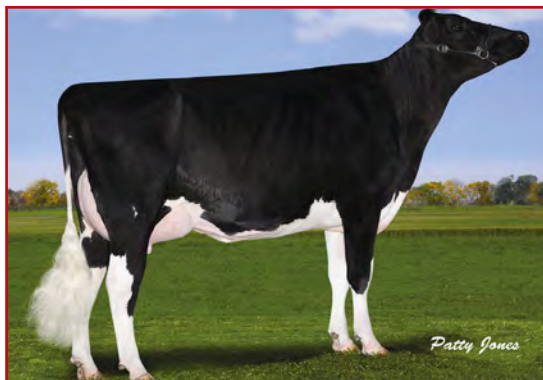
MM: Freurhaven FGS Lucy

FREUREHAVEN FGS LUCY 04-10 305 16 910 3.5% 588 3.1% 521 kg Celoživotně: 60 619 3.7% 2 221 3.1% 1 884 kg