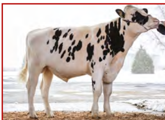
MELARRY JOSUPER FRAZZLED BLUMENFELD RUBICON 4852