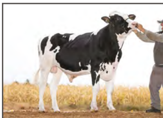
UECKER SUPERSIRE JOSUPER BOMAZ MADDIE