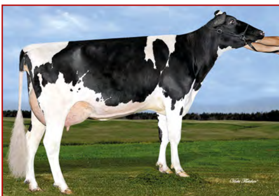
Jobert Lautrust Erika

COMESTAR LAUTAMA GOLDWYN 06-04 305 18 069 4.8% 865 3.2% 577 kg Celoživotně: 54 475 4.8% 2 604 3.6% 1 981 kg