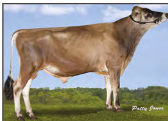
JX RIVER VALLEY CHECKMATE