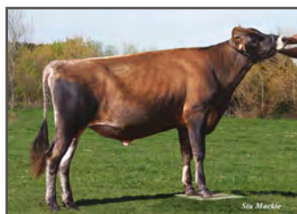
HAWARDEN IMPULS PREMIER