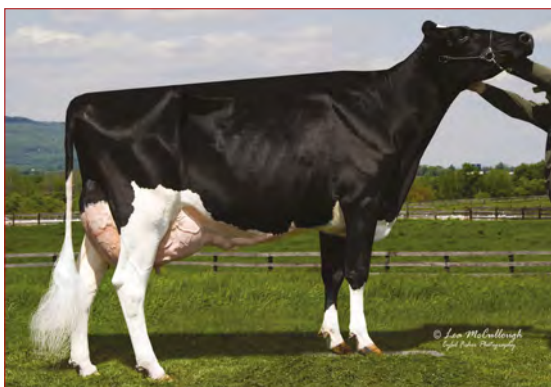
MMM: RC-LC Goldwyn Atm