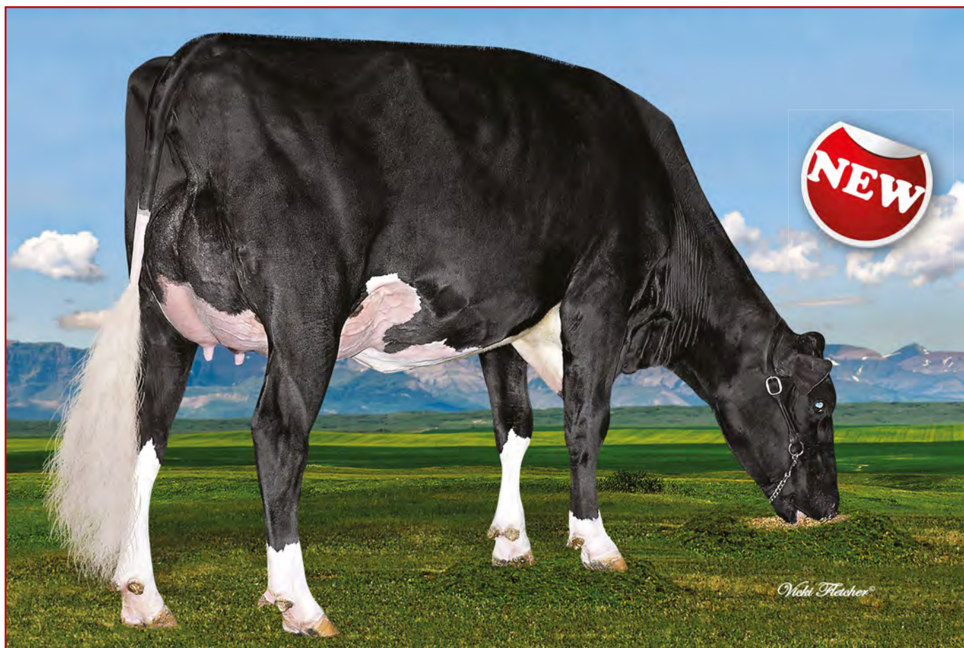
M: Westcoast Montana Riza 02-05 305 10 657 4.7% 503 3.6% 385 kg