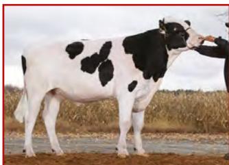
SILVERRIDGE V TIMBERLAKE PROGENESIS ROBSON BARBARELLA

(Imax x Supershot) TIMBERLAKE x ROBSON x DENVER