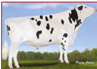
AMIGHETTI NUMERO UNO RICHMOND-FD S BARBARA