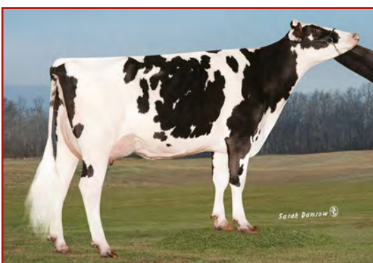
MM: Co Op Blumen Day 4292