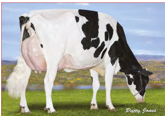
MM: Progenesis Denver Betsy

PROGENESIS DENVER BETSY 03-03 305 17 647 4.8% 852 3.3% 588 kg Celoživotně: 27 594 4.8% 1 325 3.6% 981 kg