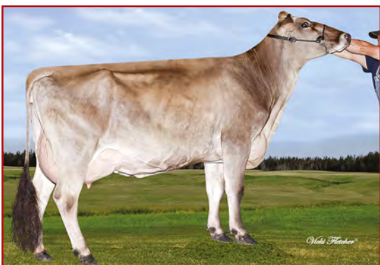
MM: Shady Lane Swiss Sup Alright

05-05 305 12 830 4.5% 573 3.5% 445 kg Celoživotně: 64 982 4.5% 2 896 3.8% 2 477 kg