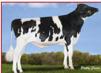
WET TUFFENUFF MAGNUS PROGENESIS SUPERSHOT PASSION