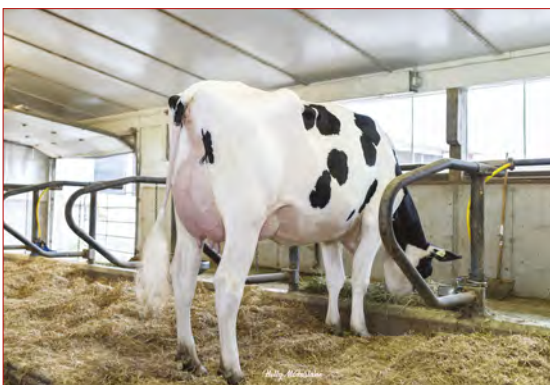
Fraeland Braemar Screenshot

PINE-TREE SHARLA DAPHNE 02-02 305 12 678 4.3% 541 3.3% 417 kg Celoživotně: 48 281 4.1% 1 977 3.3% 1 611 kg