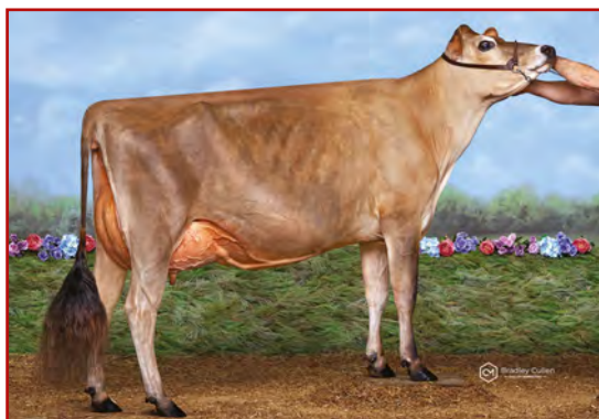
Bushlea Viral Iris