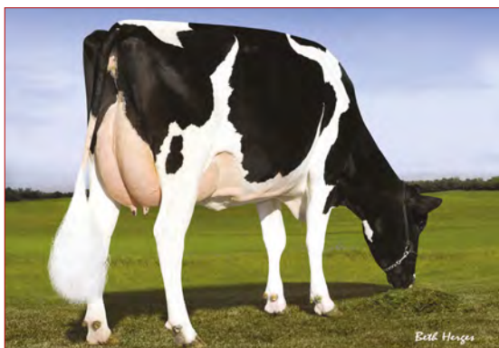
MMM: Pine Tree 2149 Robst